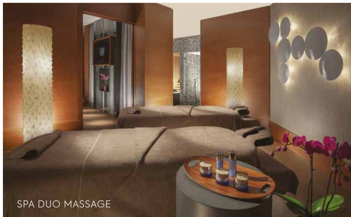
SPA DUO MASSAGE

Un soin du corps exfoliant associé à un massage nourrissant grâce à l'application d'huiles essentielles restaurant la texture et l'élasticité de la peau.